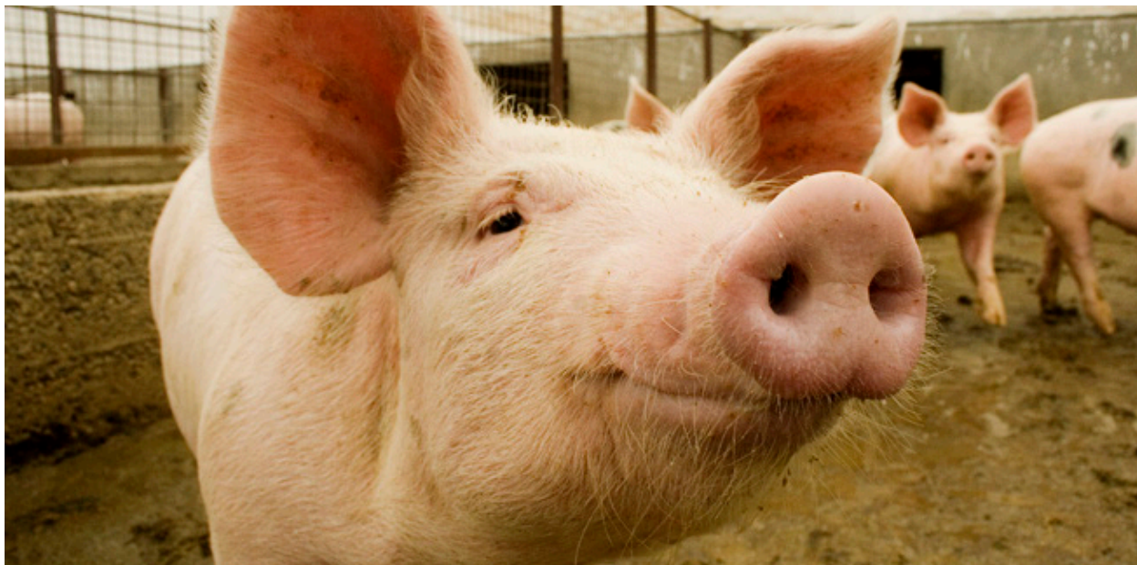
La delimitación del área donde se alojan los cerdos es fundamental en la crianza.

Asimismo, el lugar donde se alojan los cerdos debe estar limitado de tal manera que no se escapen invadiendo otra propiedad o la vía pública (contención física). El alambrado o cerco perimetral debe estar intacto para garantizar la retención de los porcinos dentro del predio e impedir el libre ingreso de animales y personas por accesos no establecidos.