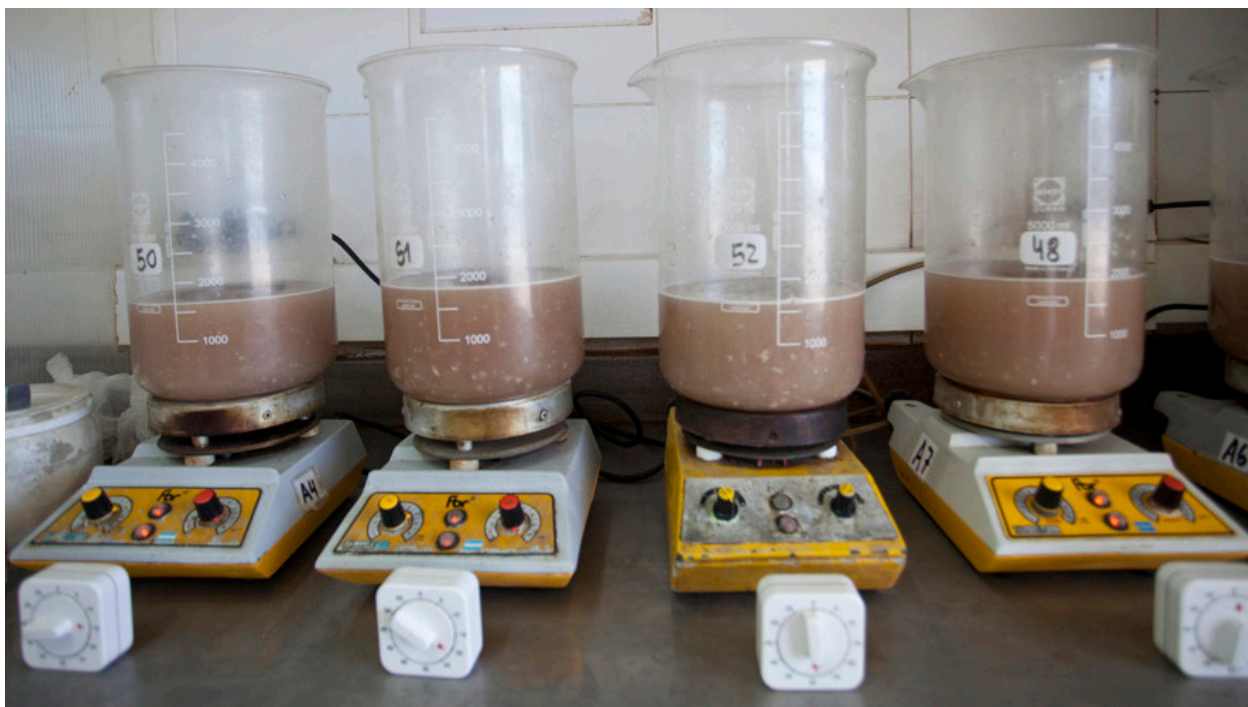
Digestión artificial. Esta técnica, que permite detectar la presencia de larvas de triquinosis en la carne fresca, debe realizarse antes de consumirla o elaborar productos.

Se debe desalentar la faena sin control sanitario y la elaboración, comercialización y el consumo de productos de cerdo elaborados a partir de carnes que provengan de faenas caseras, clandestinas o no controladas.