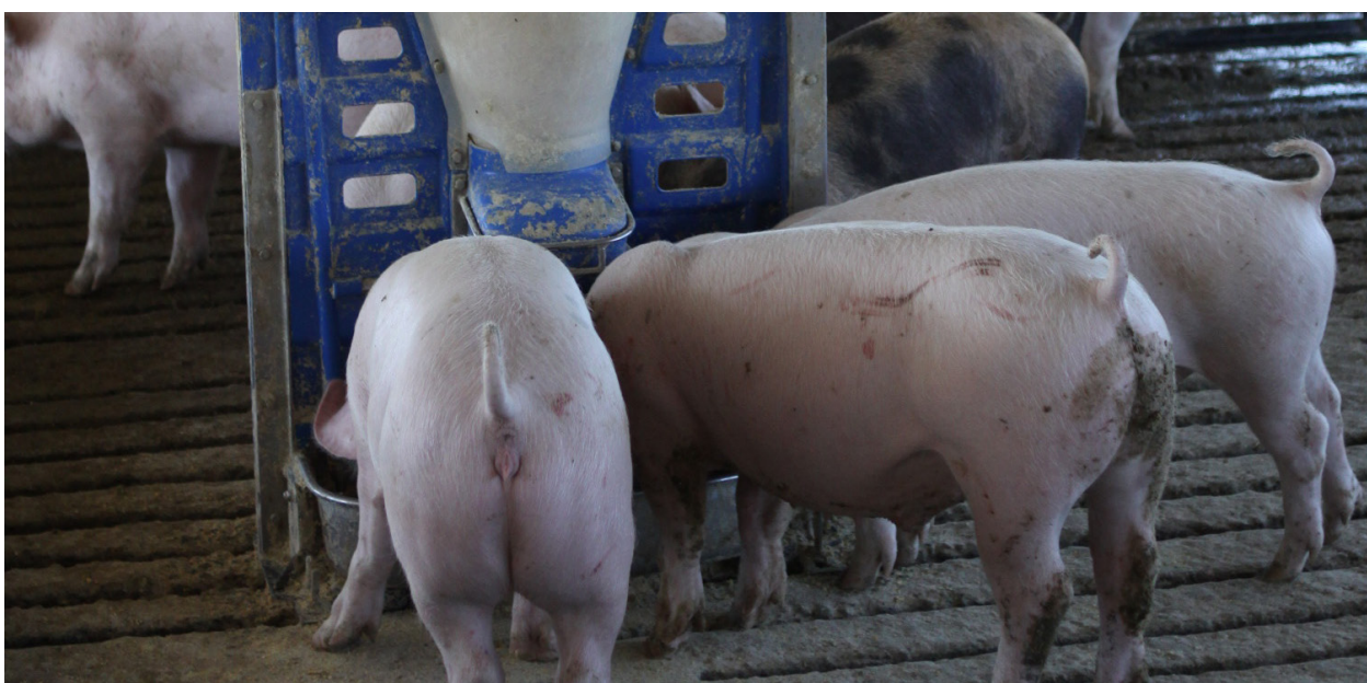
Alimentación. Proveer a los animales de alimento y agua segura es una de las claves del buen manejo de las producciones.

RECUERDE: NO ALIMENTE A LOS CERDOS CON RESIDUOS CÁRNICOS CRUDOS, CADÁVERES Y OTROS PRODUCTOS DE ORIGEN ANIMAL. ESTA PRÁCTICA AUMENTA EL RIESGO DE CONTRAER TRIQUINOSIS Y OTRAS ENFERMEDADES.